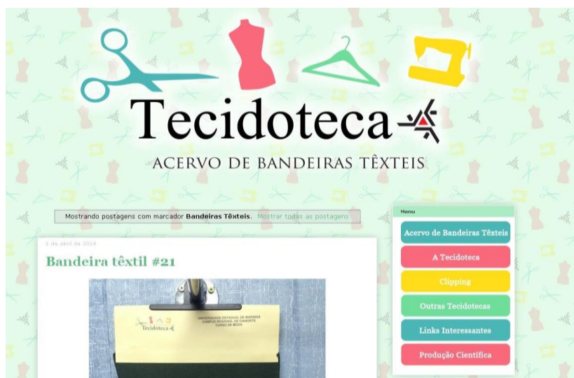
Figura 2 – Blog da Tecidoteca.

O Blog que possui visualizações de pessoas de todas as regiões do Brasil e em outros países, alcançando o objetivo do projeto que é sempre se estender para mais pessoas em nível nacional e internacional. As estatísticas demonstram visualizações de todas regiões do Brasil e outros países (Estados Unidos, Alemanha e Portugal).